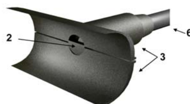
Sensor internal / Interno capsula